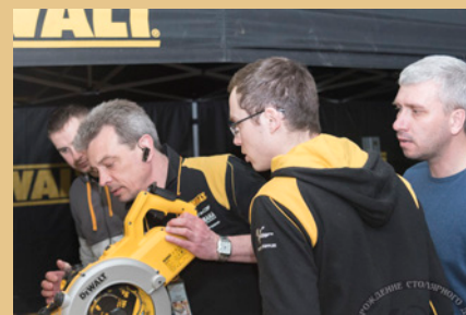
Stanley / DeWalt / Black & Decker