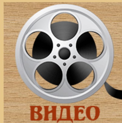
Фестиваль Столярного Дела 2017 - Видео Мастер-Классов