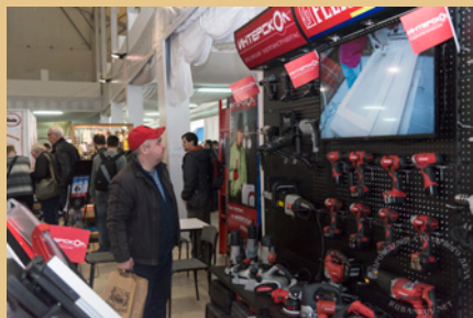
Интерскол / Felisatti