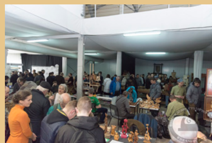
РЕЗЬБА ПО ДЕРЕВУ И СКУЛЬПТУРА - 20%