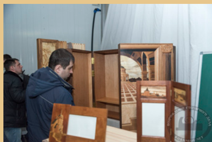
СТОЛЯРНОЕ И МЕБЕЛЬНОЕ ДЕЛО - 35%