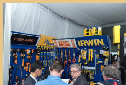
Базахолка, Скидки и Акции на инструмент