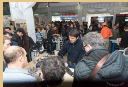
Festool на площадке ЦРИ