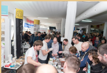
Ворота, мастер-классы каждый час