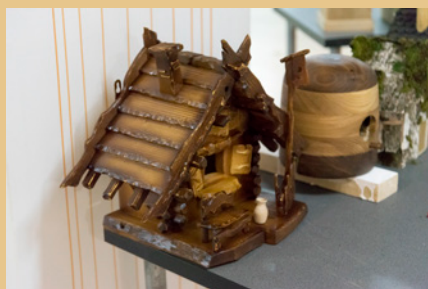
Ежегодные конкурсы (Конкурс скворечников на ФСД 2017)