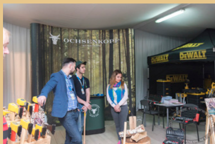
Топоры на площадке Gedore

- "... соотношение затрат и привлечённых посетителей на порядок лучше, чем на каком-либо другом мероприятии" (Тсуриги Нагасаки, Япония, производственная компания)