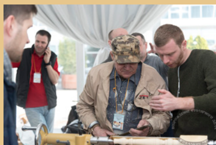
ТОКАРНОЕ ДЕЛО - 20%