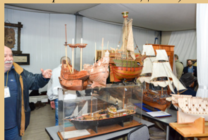
Выставка моделей парусников