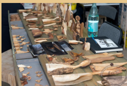
Ярмарка столярных сувениров