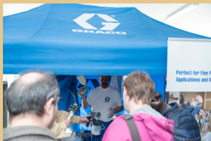
Краскопульты и турбины Graco