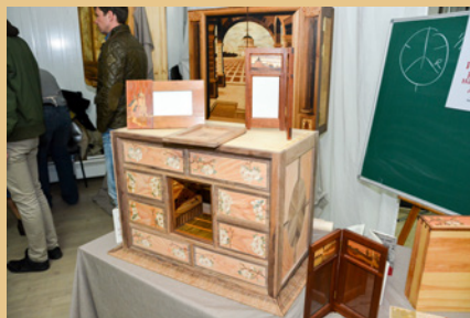
Защита дипломных работ - Дельница