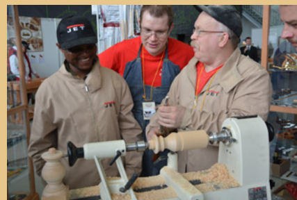
Jet традиционно собирает анилаг

- "... соотношение затрат и привлечённых посетителей на порядок лучше, чем на каком-либо другом мероприятии" (Тсуриги Нагасаки, Япония, производственная компания)