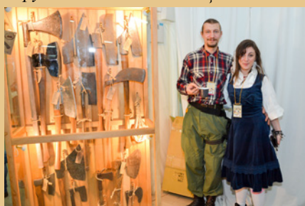
Экспозиция Музея Инструментов