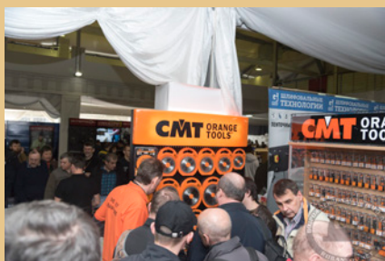
Фрезы и пильные диски CMT