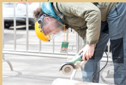
Чемпионат деревянной скульптуры