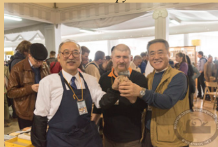
Японская столярная культура