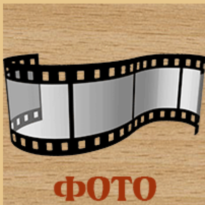
Фестиваль Столярного Дела 2017 - Фотоотчет